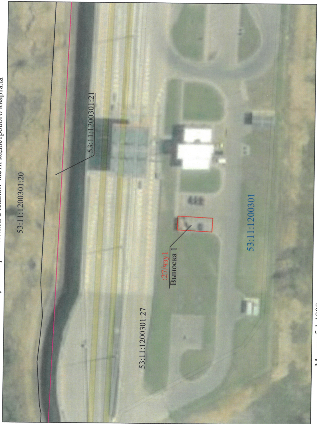
Схема расположения части земельного участка с кадастровым номером 53:11:1200301:27 на кадастровом плане территории Адрес земельного участка: Новгородская обл, р-н Новгородский, Новоселицкое сельское поселение, земельный участок расположен в южной части кадастрового квартала